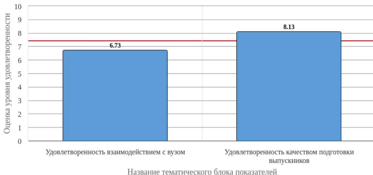
Рисунок 2.1 - Средняя оценка удовлетворенности (по тематическим блокам показателей)

Средняя оценка удовлетворенности респондентов по блоку вопросов «Удовлетворенность взаимодействием с вузом» равна 6.73, что является показателем повышенного уровня удовлетворенности (50-75%).